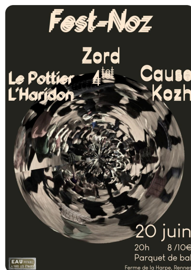
20 Juin Fest-Noz

Parquet de Bal - gratuit pour les -10ans ou 8€