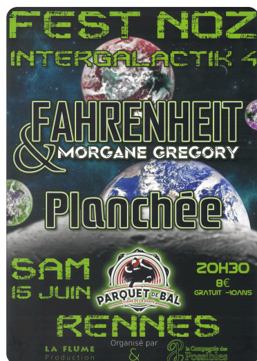
15 Juin Fest-Noz Intergalactik

Le mois de Juin est marqué par les Fest-Noz au Parquet de Bal. Venez dansez dans une dimension universelle avec le fest-Noz Intergalactik organisé par La flume production et la Compagnie des Possibles.